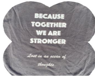
'Ocean of thoughts' Leerling Harreveld