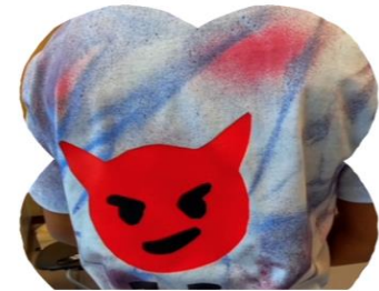
'Collage shirts' Leerling Orion