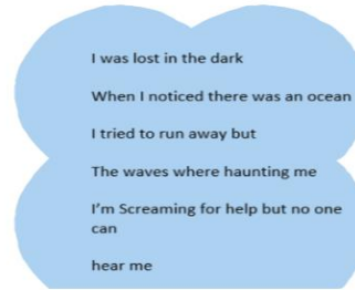
Liedje bij 'Ocean of thoughts' Leerling Harreveld