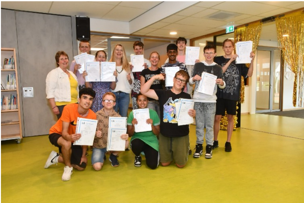
Leerlingen De ark hebben hun SVA-certificaat binnen.

Op woensdag 10 juli was het groot feest op De Ark. Waarom? Omdat er dit jaar door 12 leerlingen 20 SVA (Scholing voor Arbeid) certificaten van zowel niveau 1 als 2 behaald zijn.